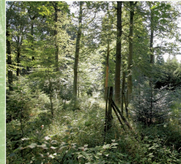
Mischwald und Tannen-Anpflanzung im NSG „Bärenbach“

Karte des Naturschutzgebietes „Bärenbach“ DTK25-V © Staatsbetrieb Geobasisinformation und Vermessung Sachsen 2010